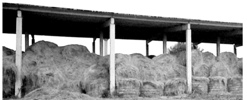
На снимке: запас сена в фермерском хозяйстве Добрыдневых (д. Лапино).