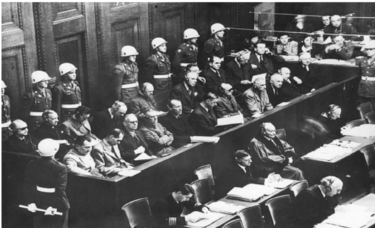
На скамье подсудимых: (1-й ряд (слева направо): Геринг, Гесс, Риббентрон, Кейтель, Кальтенбруннер, Розенберг, Франк, Фрик, Функ, Шахт; 2-й ряд: Дениц, Редер, Ширах, Заукель, Йодль, Папен, Зейсс-Инкварт, Шпеер, Нейрат, Фриче. Согласно вердикту суда 1 октября 1946 года Геринг, Риббентрон, Кейтель, Розенберг, Кальтенбруннер, Фрик, Франк, Штрейхер, Заукель, Йодль, Зейсс-Инкварт и заочно Борман приговорены к смертной казни через повешение; Гесс, Функ и Редер – к пожизненному заключению в тюрьме Шпандау; Ширах, Шпеер – к 20 годам; фон Нейрат – на 15 лет; Дениц – на 10 лет).

Такого суда история еще не знала... Нюрнбергский процесс приобрел всемирно-историческое значение как первое и по сей день крупнейшее правовое деяние Объединенных Наций. Единые в своем неприятии насилия над человеком и государством народы мира доказали, что они могут успешно противостоять всеобщему злу, вершить справедливое правосудие. Горький опыт Второй мировой войны заставил всех по-новому взглянуть на многие проблемы, стоящие перед человечеством,