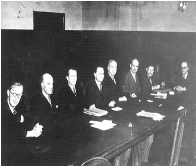
Члены Международного суда над военными преступниками.

20 ноября 2015 года исполнилось 70 лет с момента начала Нюрнбергского процесса над главными военными преступниками Германии. Нюрнбергский процесс – международный судебный процесс над группой главных нацистских военных преступников, который проходил в Международном военном трибунале в Нюрнберге (Германия). Давайте вместе вспомним эту окончательную победу